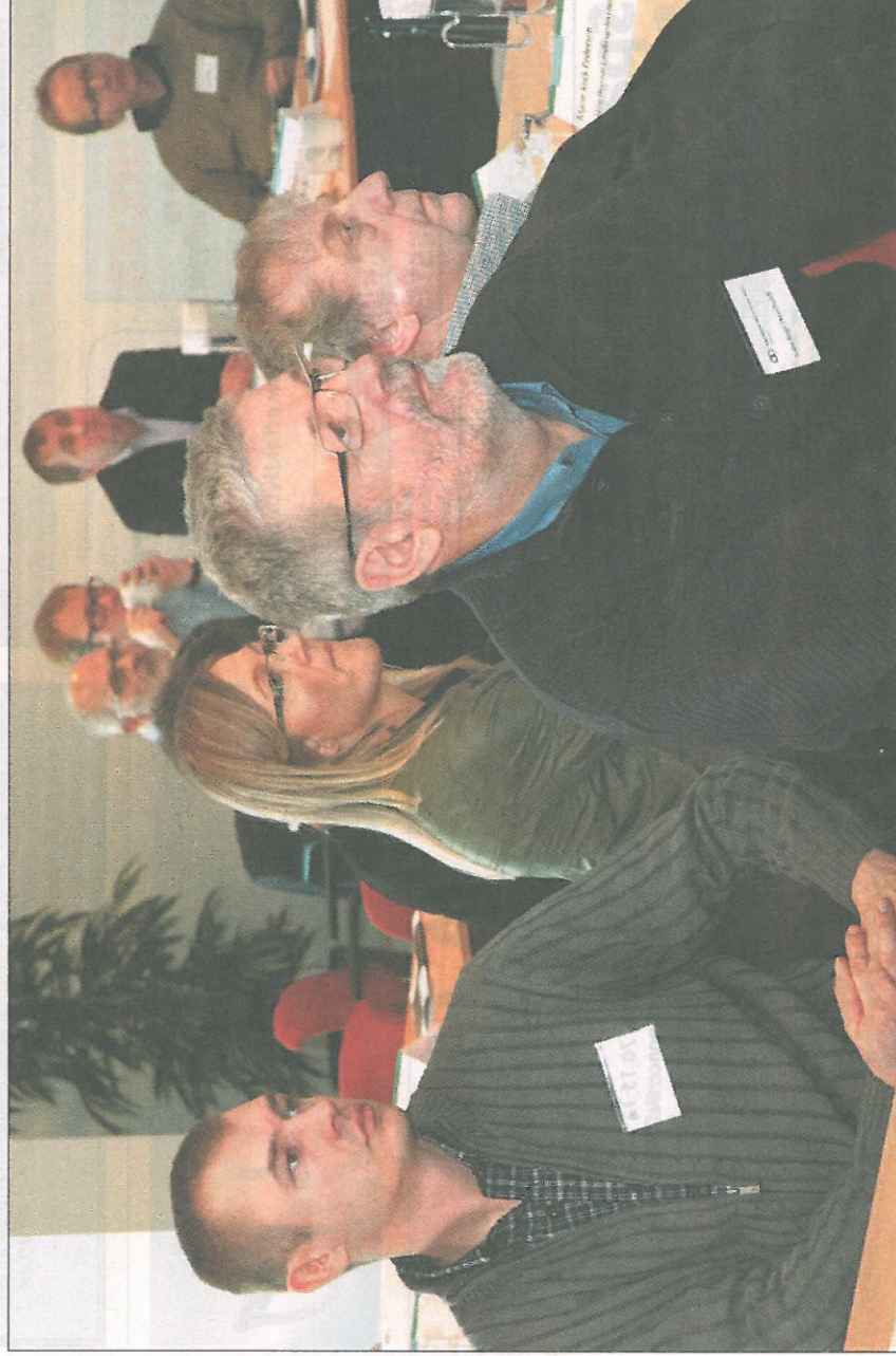
I andet kvartal 2010 lå jordpriserne på mellem 150.000 og 160.000 pr. hektar. De er formentlig faldet en tand yderligere siden, lød vurderingen over for de fremmødt på Økonomiens Dag.

- Der går typisk et år fra, at vi har en situation med store ændringer i jordpriserne, til det har forplantet sig i investeringsomfanget. Jeg kan godt tvivle på, om effekten har nået at forplante sig fuldt ud endnu